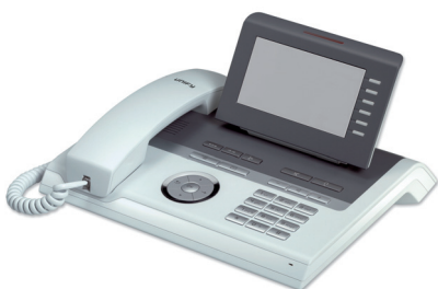
OpenStage 40 T