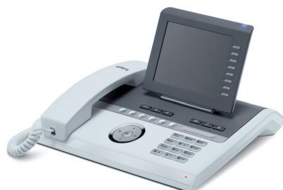
OpenStage 60 T