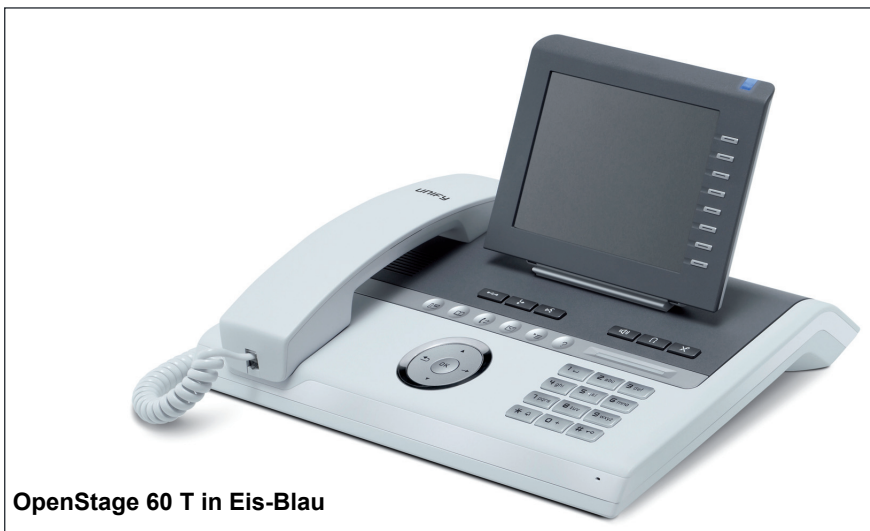
OpenStage 60 T in Eis-Blau

Zu den OpenStage Designschwerpunkten gehören verschiedene Material- und Farbvariationen.